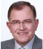
Erwin Dotzel Bezirkstagspräsident

„Dort arbeiten zu können, wo alle anderen auch arbeiten – das ist gelebte Inklusion. ‚Mensch Inklusive‘ schafft diese Möglichkeit und daraus entsteht eine einzigartige Win-win-Situation für Mitarbeiter/-innen und Unternehmen.“